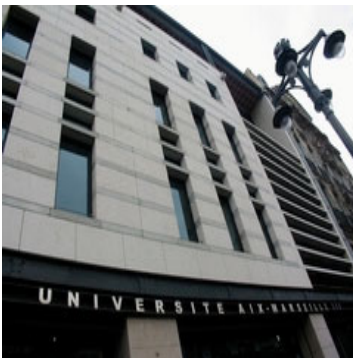
La FE A Canebière

à Marseille en ses locaux au 110 de la Canebière